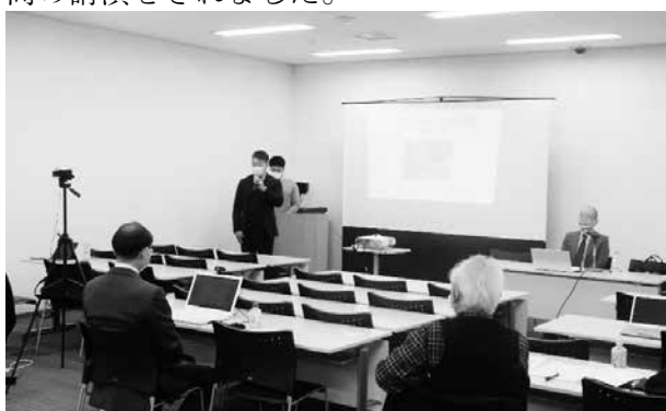
ミューザ川崎での録画風景

Zoomならこの方ということで、毎月Zoomで“かわみ勉強会”をオンライン配信している梅本先生が講師を務められ、約1時間の講演をされました。